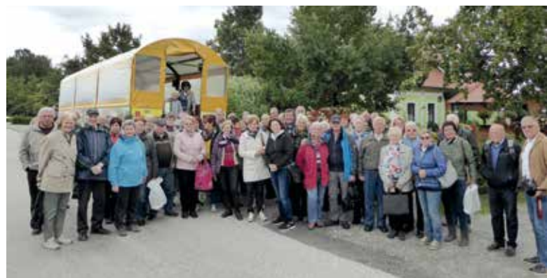
Am Zigeunerwagen vor der Harter Teichschenke.

■ Die Herbstfahrt des PV OG Spielberg führte 85 Personen in die Oststeiermark. Mit 2 Bussen ging die Fahrt zum Großharter Naturteich. Mit dem Zigeunerwagen besichtigten wir das Thermenland. Durch den Kurort Bad Waltersdorf, vorbei an den Hotels und der Heiltherme ging die Fahrt zur Waldgrotte Maria Brunn. Die Rundreise führte weiter zur Hundertwassertherme Bad Blumau, vorbei an den Glashäusern der Frutura Thermal Gemüsewelt zurück ins Kerzenland Waltersdorf. Nach einer Einkaufspause ging die Fahrt weiter an der H 2 O Therme Sebersdorf vorbei nach Auffen zum Kneipp Aussichtsturm. Der Rundblick reichte von der Koralpe, dem Wechselland bis in die ungarische Tiefebene. Zurück in der Harter Teichschenke ging der Tag bei einem guten Mittagessen, einer Teichrundwanderung und einer Nachmittagsjause und anschließender Heimfahrt zu Ende.