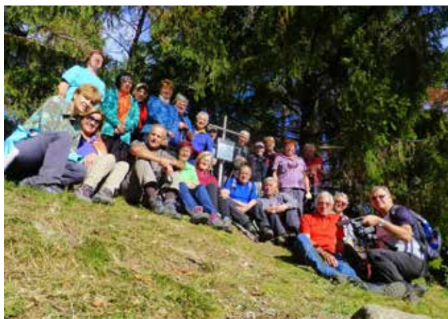
Die Wandergruppe auf der Adlitzten.